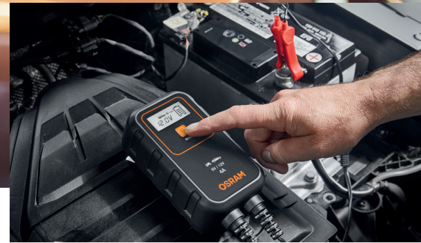
Chargeurs et boosters SÉRIE OEBCS900