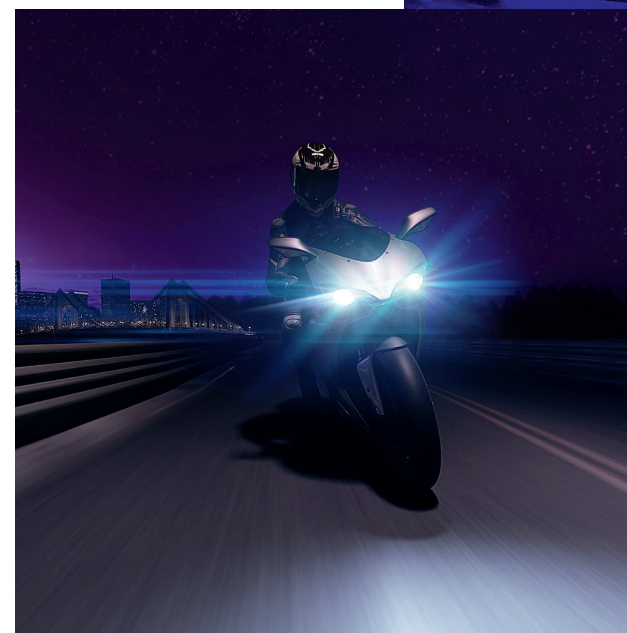
Éclairage cycle motorisé