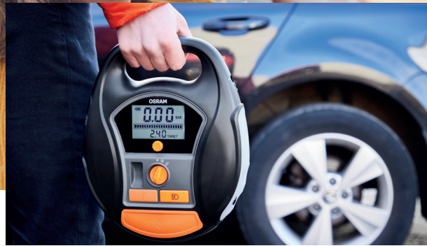
Compresseurs d'air OTIR6000 ET OTIR4000

Au-delà de l'éclairage, une gamme d'accessoires innovants