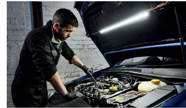
Lampe d'inspection LEDINSPECT LEDIL415