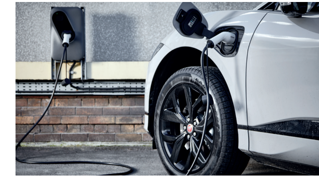
Câbles de charge Véhicules électriques et hybrides

OSRAM Automobile facilite considérablement l'entretien des pneumatiques grâce à des compresseurs d'air de qualité supérieure.