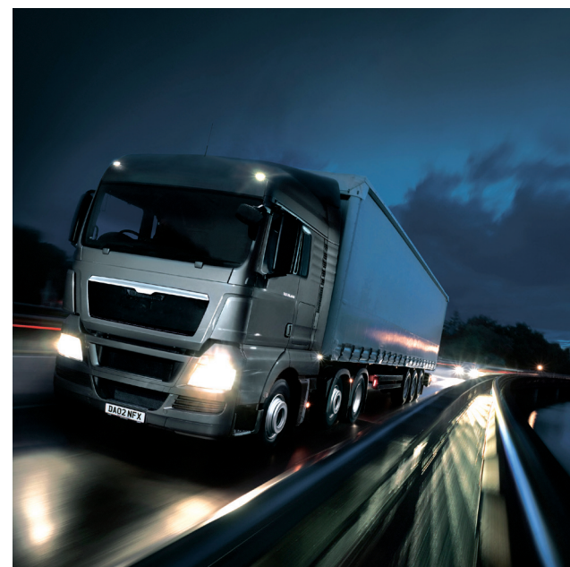
Éclairage poids lourds